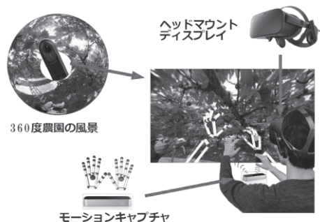
図 1 サクランボ狩りシステムのイメージ

システムはヘッドマウントディスプレイ(Oculus rift)、モーションキャプチャ(Leap