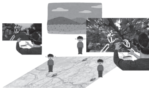
図 3 インタラクティブマップのイメージ

今後, サクランボ狩りだけではなく, イチゴ狩りなども追加する予定である. また現在システムの PR 効果を評価しているため, Unity を用いてシステムを構成している. しかしながら, 地域文化の発信するために, マップと連携し, ウェブブラウザで体験できることが重要と考えている. そのため, WebGL での開発を検討している. 図 3 にインタラクティブマップのイメージを示す. マップと連携し, マップ上の農園を選ぶことで, バーチャル体験ができ, 地域文化の発信の一助となることが期待できる.