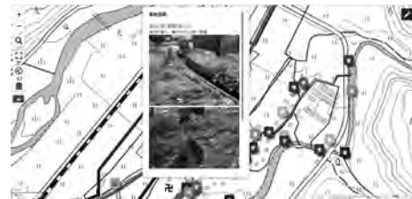
図 3 マーカークリックでその位置で起きたことを表示する

注意を促す Web アプリケーション「危険箇所通知ナビ」の作成を行った. 通知ナビではスマートフォンの GPS 機能とバイブレーションを使用することでシステム使用者の位置情報を取得し, 危険箇所と蓋のない水路に近づくと通知する機能を持つ (図 4).