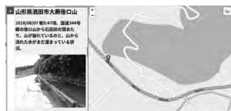
図8 サイドバーでの情報表示

また、再生終了後モーダルウィンドウを閉じるとクリックしたマーカーをズームすることでどこに関する動画だったのかを示し、場所に関する文章と写真をサイドバーに表示する（図8）。大きい文字での表示が可能のため文字が読みにくい方への対応も可能になる。