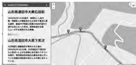
図9 大雨災害マップ

伝承マップで使っているシステムを平成30年度山形県酒田市八幡地域で行われた防災楽習フェスにて「大雨災害マップ」として公開している(図9) [15]。動画の上映も同時に行っていたが動画のみの上映ではわかりにくい動画の撮影位置やその位置に対する情報がわかりやすいと評価をもらった。また、デスクトップ上での表示だけではなくマルチディスプレイの大画面でも表示することでスマートフォンを持たない人にも見せることができた。「水路マップ」のような共有を目的とする取り組みにマップは有効であると言える。