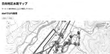
図 2 危険箇所通知ナビ