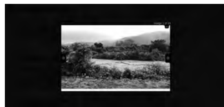
図7 大雨時の川の動画を再生した様子

このシステムではマップ上に表示しているマーカーをクリックするとその場所について伝える動画がモーダルウィンドウ上で再生される（図7）。