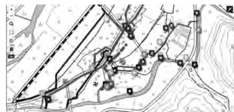
図 1 uMap で作成した水路マップ

山形県酒田市日向地区では国土交通省の「平成 29 年度雪処理の担い手の確保・育成のための克雪体制支援調査」に採択され、GIS を用いた水路マップの作成を行った [5]。これには本学のプロジェクトにて学生が実地調査、撮影を行い uMap を使用し、作成した (図 1)。また、この講義で作成したデータを用いて水路に近づく注意を促す危険箇所通知ナビ (以下、通知ナビ) を作成した (図 2)。