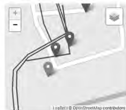
図 4 危険箇所通知ナビを使用した様子

この通知ナビは, 実際に日向地区で行われた除雪ボランティア活動にて使用した. 危険箇所に近付くと画面上で注意を促すだけでなく, バイブレーションによって防寒具の上からでも確認することができた.