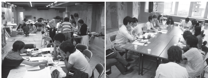
図3 滞在型まちづくり教育プログラムの様子

(左) 早稲田大学オープン教育センター「都市活性化のデザイン」エスキースチェック (右) 慶應義塾大学学生支援GP「酒田スタディツアー 2009」ディスカッションタイム