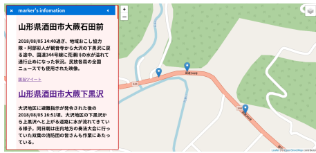
図 6 大雨災害マップの画面