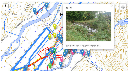
図 2 危険箇所通知ナビ