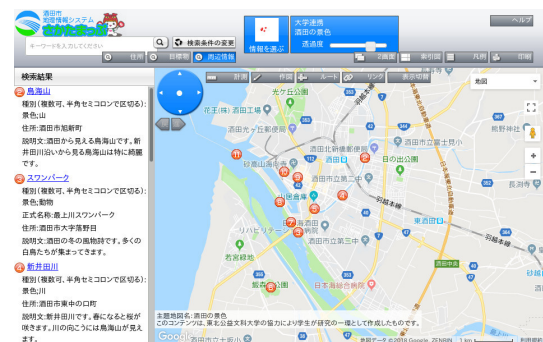
図 1 さかたまっぷ

これらをふまえて, 作成者の意図に応じて動的に見せるレイヤを生成するマップシステムを設計・構築する.