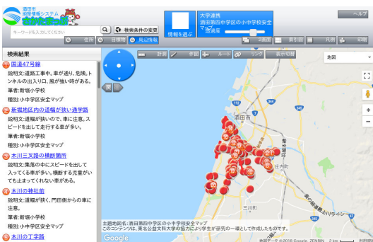
図 3 小中学校安全マップ

を得る機会が増えている。また、提供するための仕組みも整備され、構築することも手軽にできるようになってきた。